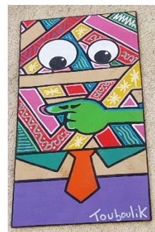
Fresque sous un porche, rue Saint-Malo. Mosaïque place Hoche et œuvre de Touboulik.

Moi, je trouve que c'est un art magnifique, car il est montré à tout le monde et ça fait de Rennes un endroit encore plus beau qu'il était déjà !