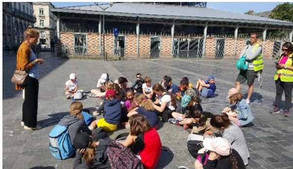
Fresque de la Place des Lices, devant la Halle Martenot.