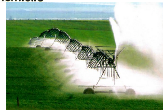
2 Une consommation en eau inégale selon le territoire