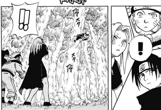
Extrait du manga Naruto (volume 3)

Les mangas ont un style bien à eux dont voici les principales caractéristiques :