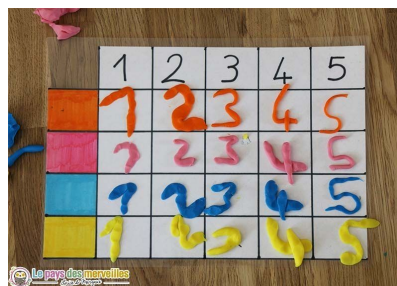
Tableau à double entrée