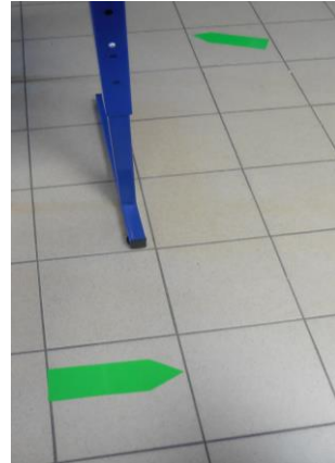
Tables et chaises éloignées les unes des autres d'au moins 1 m. Sens giratoire, avec marquage au sol.