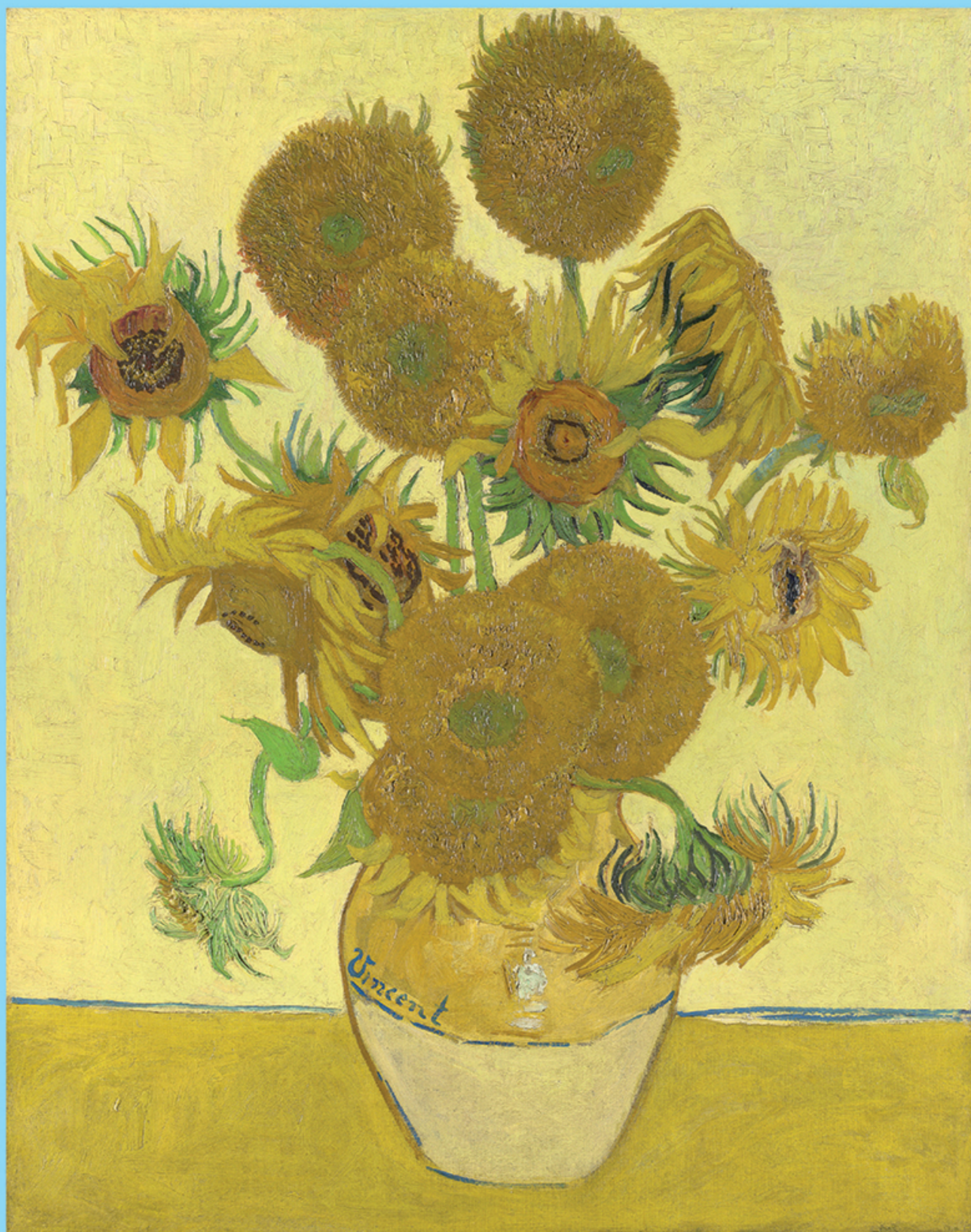
Tournesols, Vincent Van Gogh, 1888

Essaie les pastels gras ou les crayons à la cire. Utilise différentes nuances de jaune, de beige et de vert pour les fleurs.